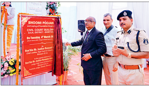
हरिभूमि न्यूज ►► बेमेतरा