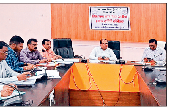
हरिभूमि न्यूज ►► बेमेतरा

आगामी 8 मार्च को अंतर्राष्ट्रीय महिला दिवस के भव्य आयोजन को लेकर मंगलवार को जिला पंचायत सभाकक्ष में स्वच्छ भारत मिशन (ग्रामीण) की प्रबंधन समिति की बैठक आयोजित हुई। बैठक की