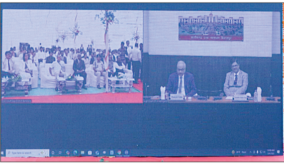
हरिभूमि न्यूज ►► बेमेतरा